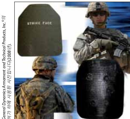
General Dynamics Armament and Technical Products, Inc.의 허가 하에 사용된 사진입니다(2008년).